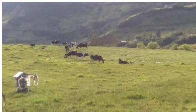
Actividad ganadera de la parroquia