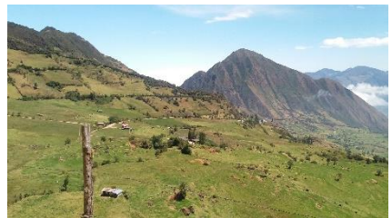
Atractivo turístico de la parroquia (Majestuoso cerro Puñay)